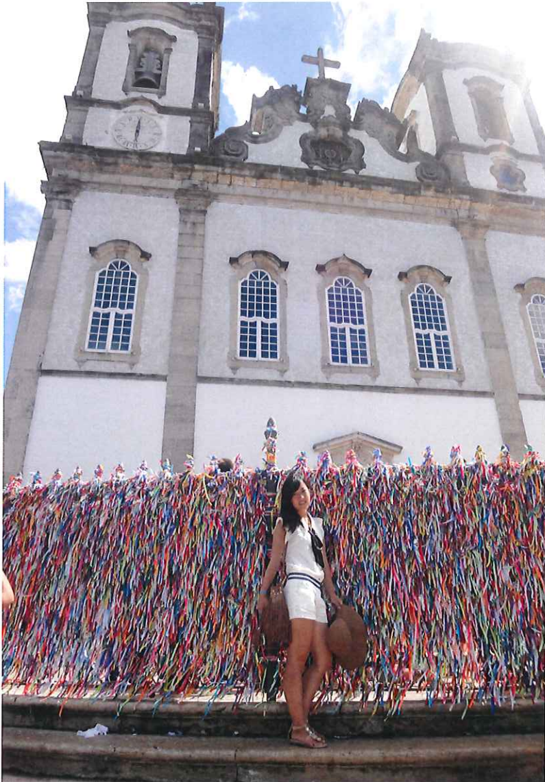
←たくさんのブラジルのミサンガと教会です この教会では号泣してしまいました