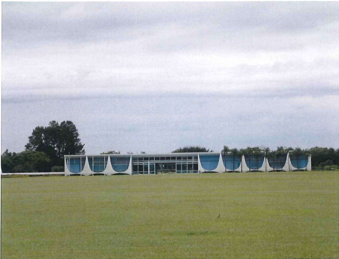
↑ 旅行で行ったブラジルのホワイトハウスです。大統領が住んでいます