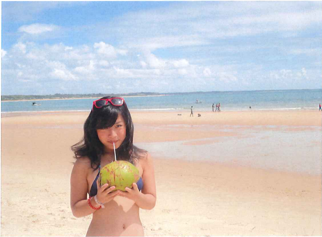
↑ THE BRAZIL!!