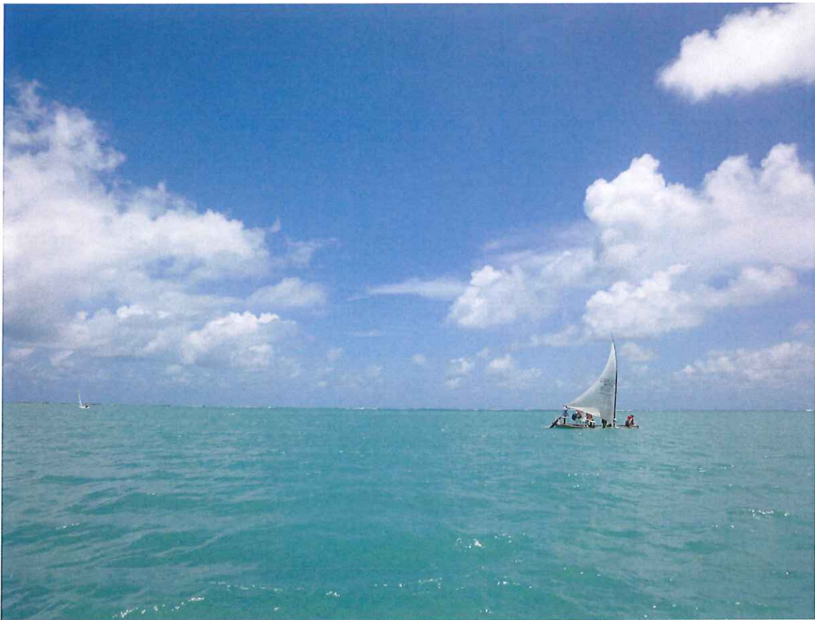
↑私の人生のなかで1番きれいな海でした