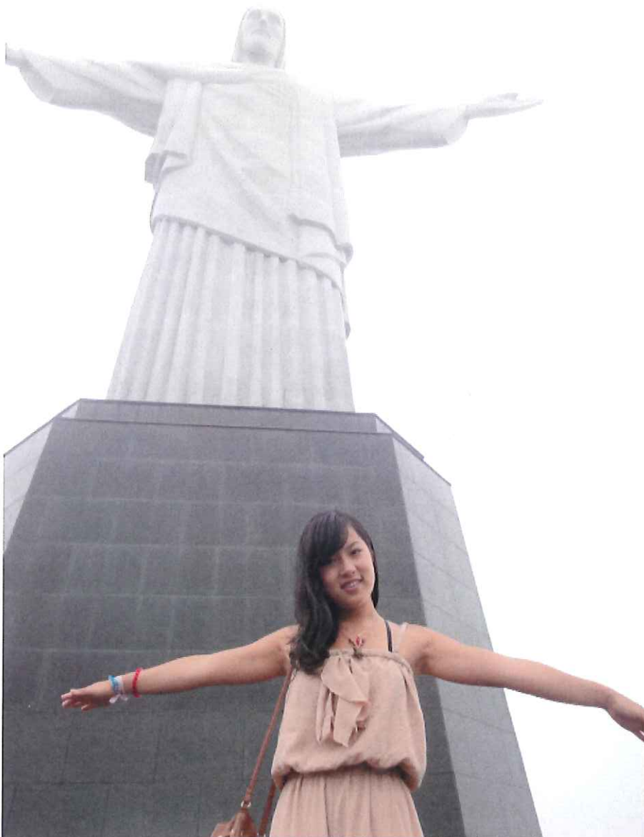
キリスト像は本当に感動しました