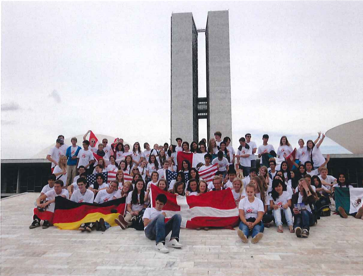
↑ 留学生全員です(日本国旗なくてすみませんW)