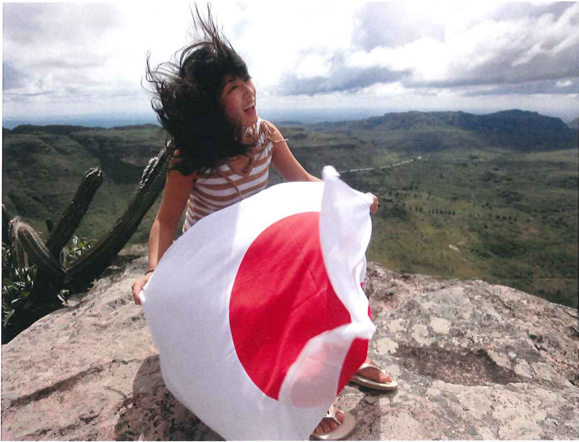
↑これはお気に入りの1枚です