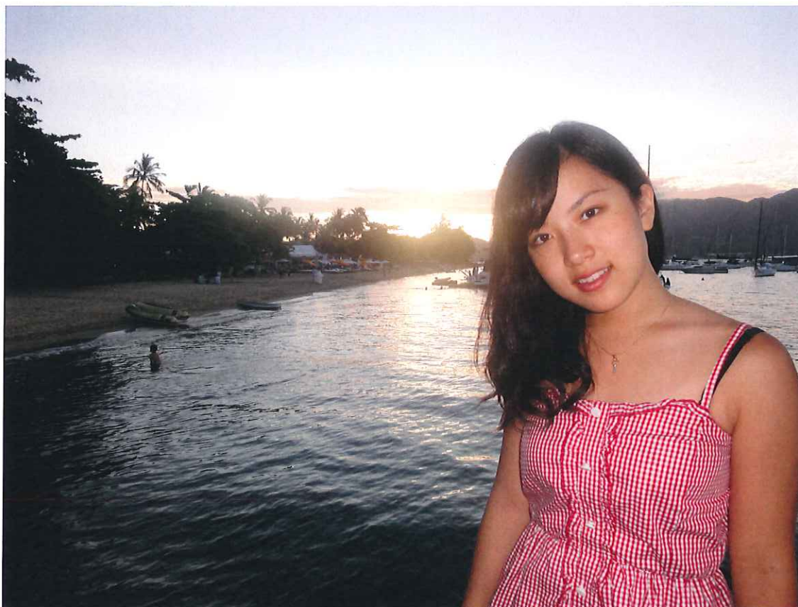
↑ILHA BELA のビーチは本当にきれいで逆に合みたいですねW