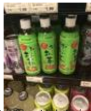
おいお茶を見つけました。

Chipotle というレストランで食べたタコス風のサラダです。サブウェイのように野菜などが並んでおり、直接窓越しに何が欲しいかをオーダーします。アメリカではタコスがかなりメジャーで、マックスやウェンディーズのようなファストフードのタコスのお店も多くあります。