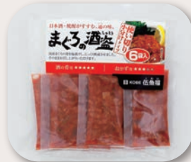
▲これぞ逸品…まぐろの酒盗(しゅとう)