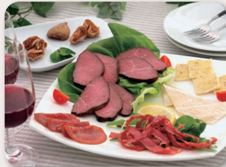
▲奥が深い、珍味の世界