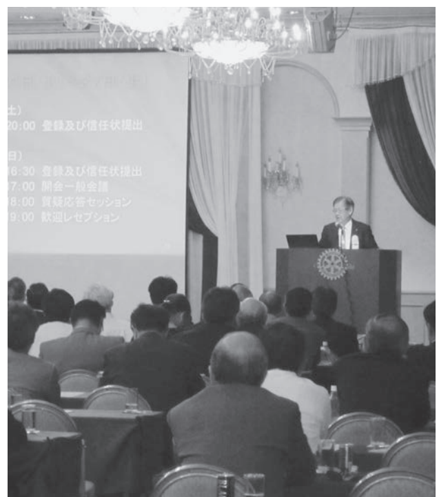
規定審議会結果報告会（5月26日開催）