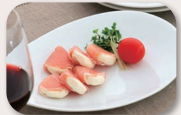
▲ワインにぴったり、クリームチーズ生ハム包み