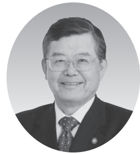
国際ロータリー第2680地区 ガバナー 石丸 鐵太郎 (神戸南)