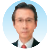
城 守 (姫路)