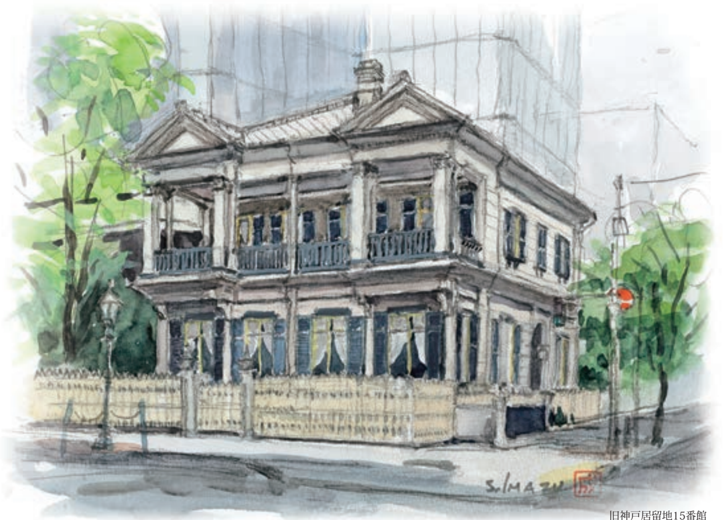
旧神戸居留地15番館

6F Hyogo Toyota Bldg., 4-2-12, Isobe-dori, Chuo-ku, Kobe, Hyogo, 651-0084 Japan