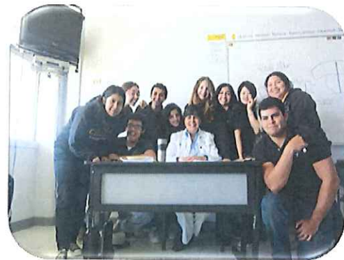
↑英語のクラスメイト 最終日は授業をせずただお話をして終わりました(笑)