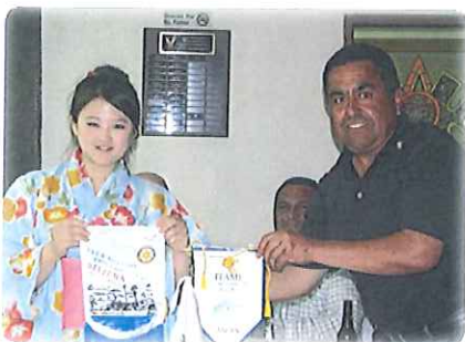
バナー交換しました!