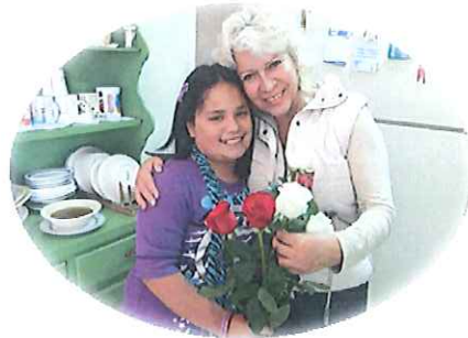
↑ホストママと従妹

5/12-18の約一週間私の母と叔母さんがメキシコまで来てくれました!!少しハードなスケジュールでしたがロータリーのミーティングまで着いて来てくれてこっちの方々に私の家族を紹介することが出来て良かったです!!