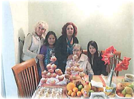
左からホストママ、従妹、叔母さん、おばあさん

日本では5/13ですがメキシコでは10日が母の日でした!私たちはいつも自分のお母さんにありがとうの気持ちを伝えるというイベントですがメキシコではすべてのお母さんに対してまた、すべての女性に対して“母の日おめでとうございます”という感じで祝うメキシコならではの祝い方に驚きました!!私は学校が終わった後ホストパパのお母さんの家にご飯を食べに行きました。毎年母の日には親戚が集まって食事をするのがこの家の決まりだそうです!私は弟と一緒に早めに家に帰ったので全員と会うことが出来なくて残念でしたが新しい親戚の方と知り合うことが出来、いろいろお話をすることが出来て良かったです。