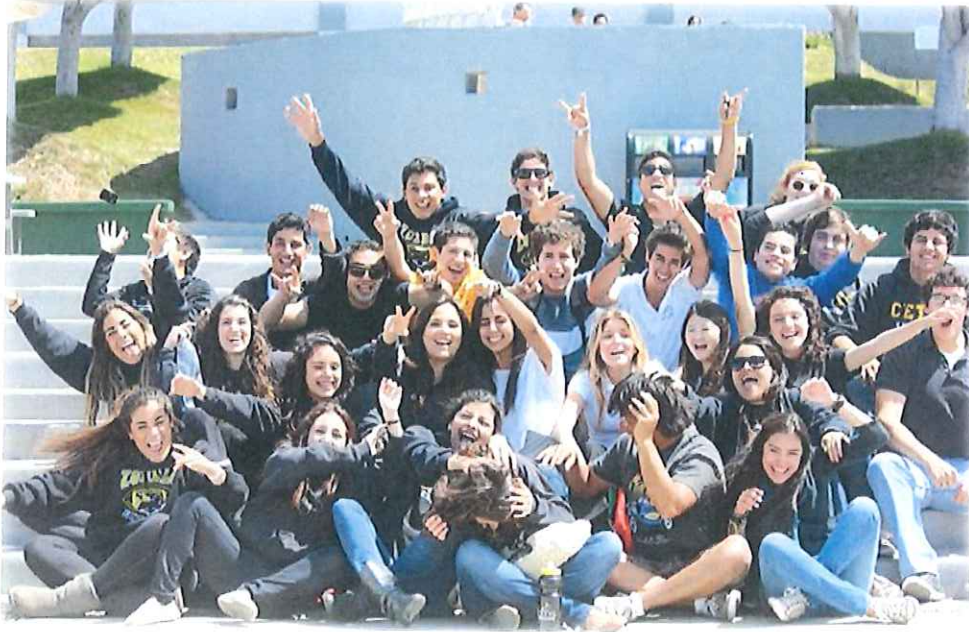
私のクラスメイト! 本当にワイワイして騒ぐことが大好きな人の集まりです◎◎