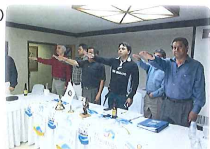
私のクラブの様子

私は主に日本の四季に合わせて何があるか、日本とメキシコを比較したグラフなどをつくって説明し、最後には私の家族について話した後感謝の言葉で締めくくりました。終わった後、ロータリーの方々からたくさん質問を頂いて、日本に興味を持ってくれているのだと実感しました!!最後におつまみ用に作ったお好み焼きを“この料理は大阪名物です”と説明して、食べて貰いました。とても美味しかったと皆さんに言ってもらい気に入って貰えたみたいで良かったです。多分こっちの人にはお好み焼きソースが合うみたいです(笑)