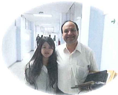
↑地理とエコロジーの先生 本当に良くしてくれてとてもお世話になった先生です!!