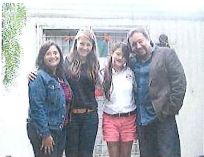
第3ホストファミリー家