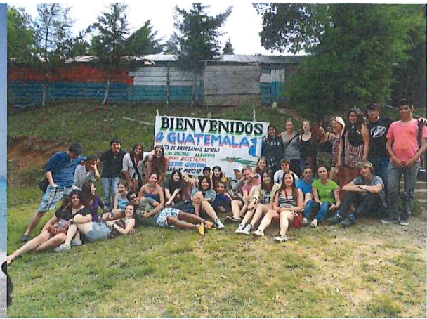
↑グアテマラ共和国