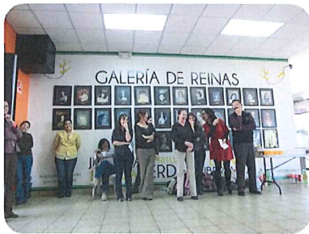
私たちの学年を担当してくださっている先生方