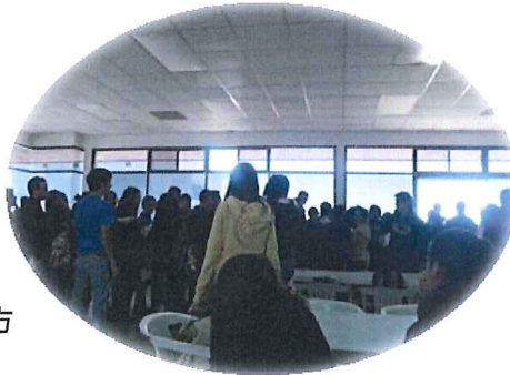
↓タコスを食べるための行列(笑)