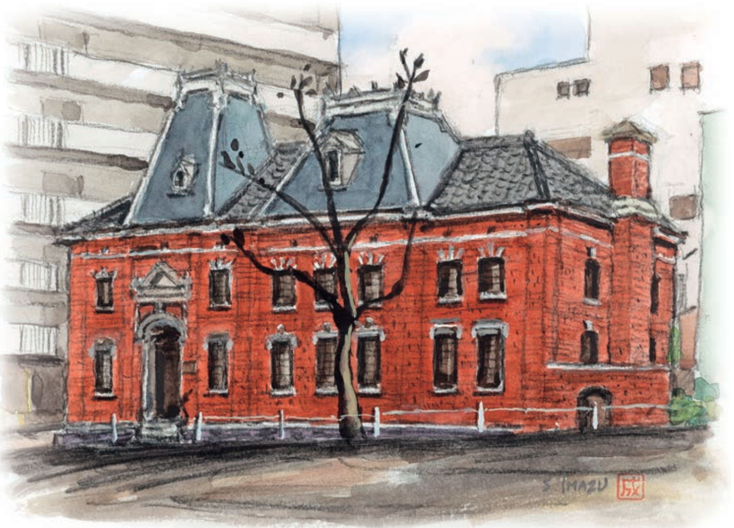
旧東京倉庫兵庫出張所(現石川ビル)

6F Hyogo Toyota Bldg., 4-2-12, Isobe-dori, Chuo-ku, Kobe, Hyogo, 651-0084 Japan