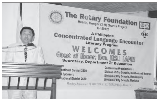
▲3Hプログラムとして、ロータリー財団から承認されたあと、2007年9月にフィリピンの文部省で、ラプス文部大臣同席のもと承認祝いの感謝の言葉を述べました。

PDGがCLEプロジェクトの参加要請を打診され、そのあと私が引き継ぎを受けました。その後3つのマッチンググラントを実施し、2006年2月にプロポーザル(提案書)を出し、4年かかって2007年4月21日にCLEによる3Hプログラムが、日本で初めて承認されました。