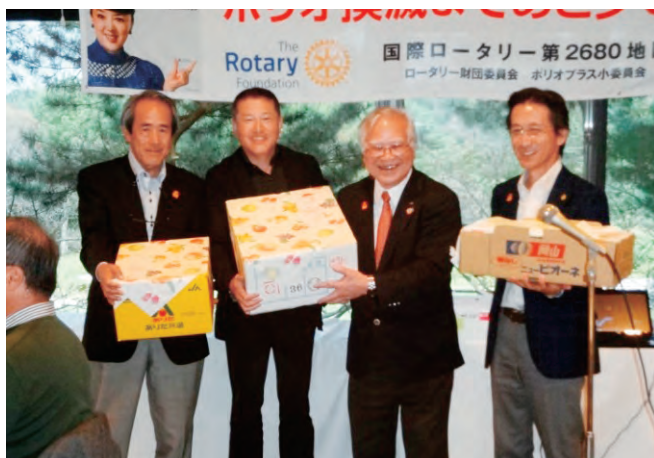
団体優勝 姫路ロータリークラブ