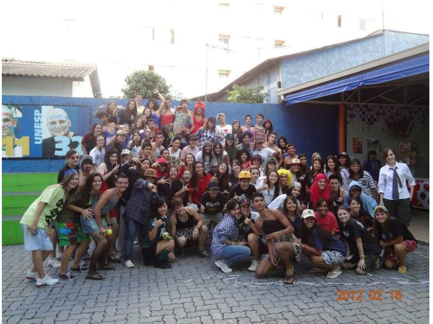
この日は男の子が女装して女の子が男装する日でした！wこゆうのは毎月ありますっ！