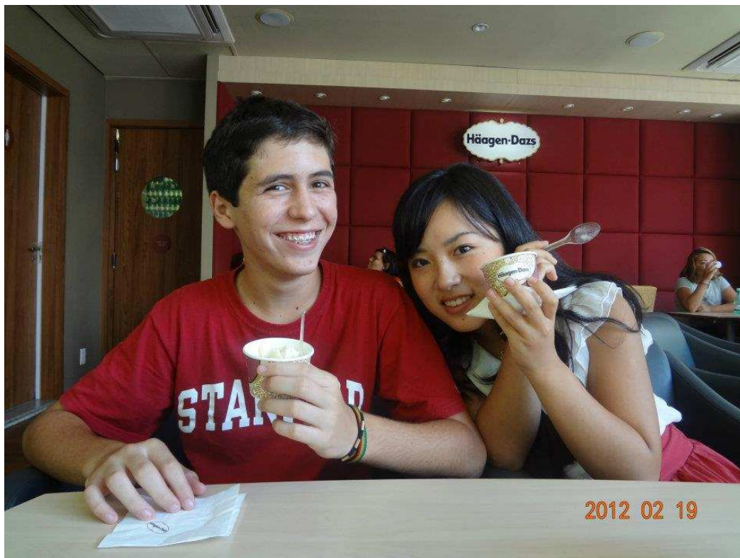
ブラジルで初めてハーゲンダッツに行きました^^写真は弟と