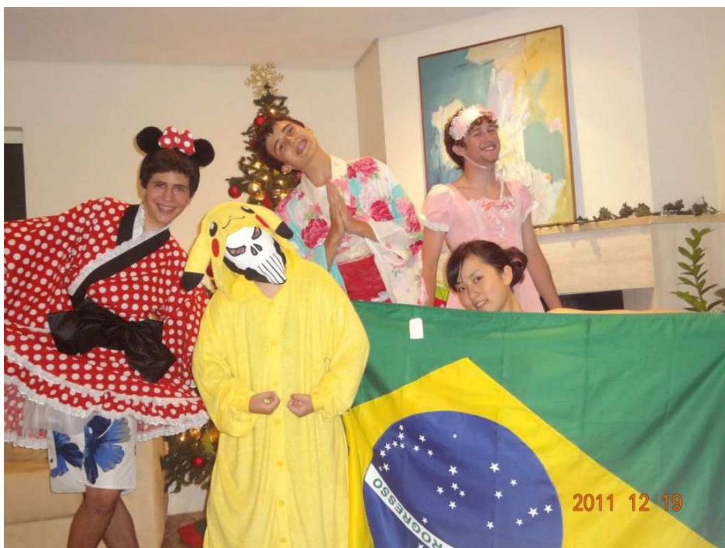
私が持ってきたグッズでみんなでコスプレですw