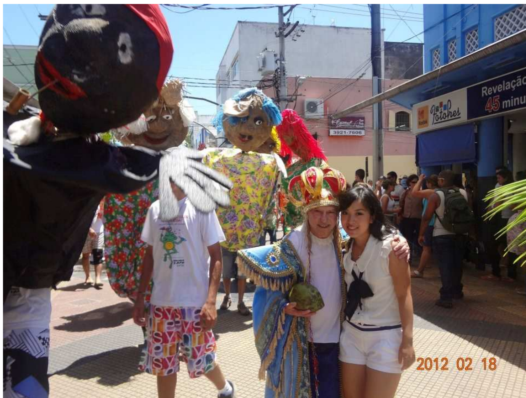
私の人生初のカーニバルです