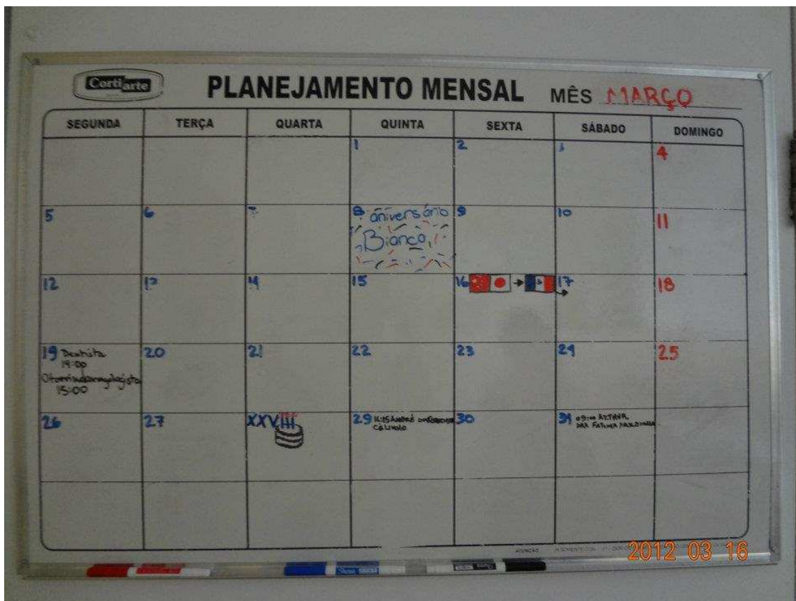
↑ 3月のスケジュールです。私の移動する日と次のメキシコの子が来る日が書いてあります