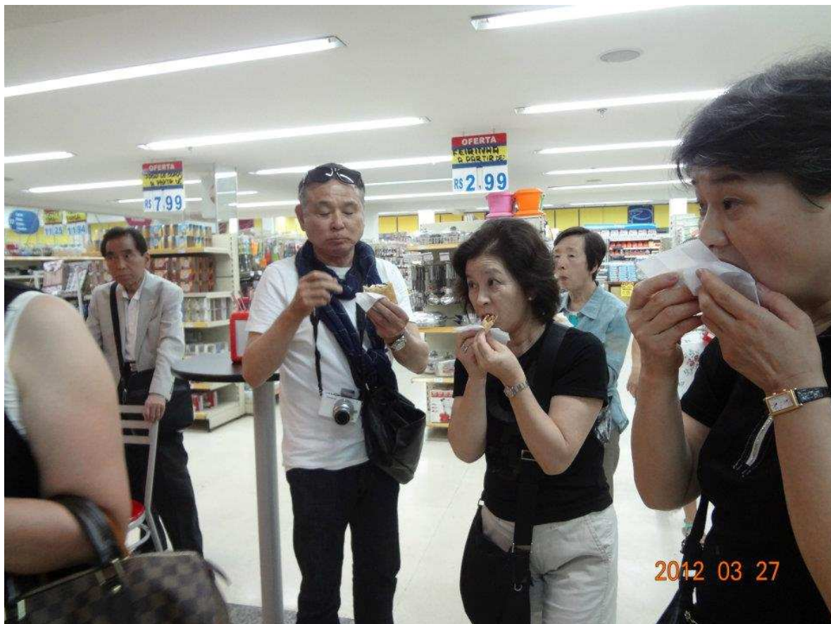
↑ みんなで pastel とゆう揚げ物を食べています