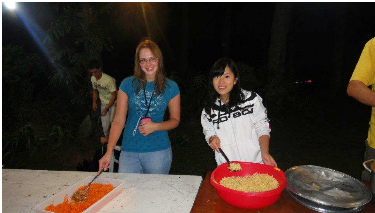
↑お料理を配るお手伝いもしました^^