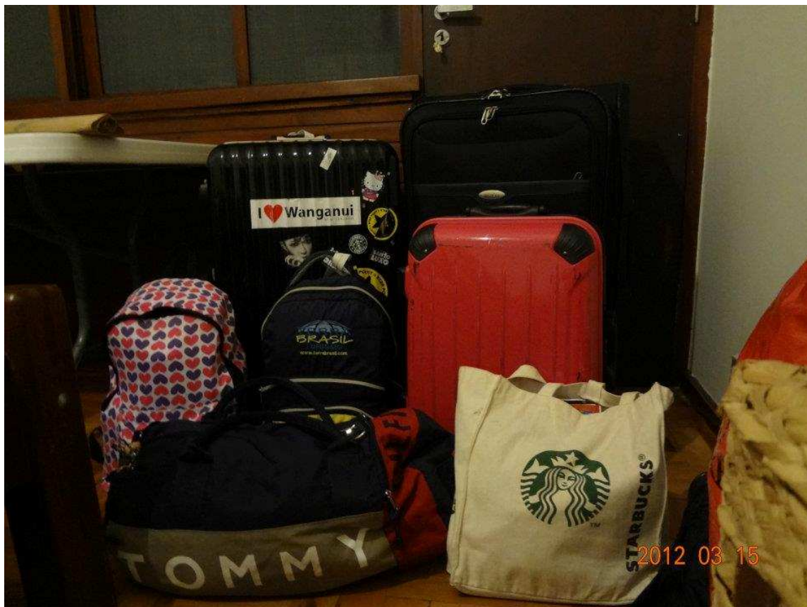
↑ 移動のときの荷物ですものすごく増えてしまいました