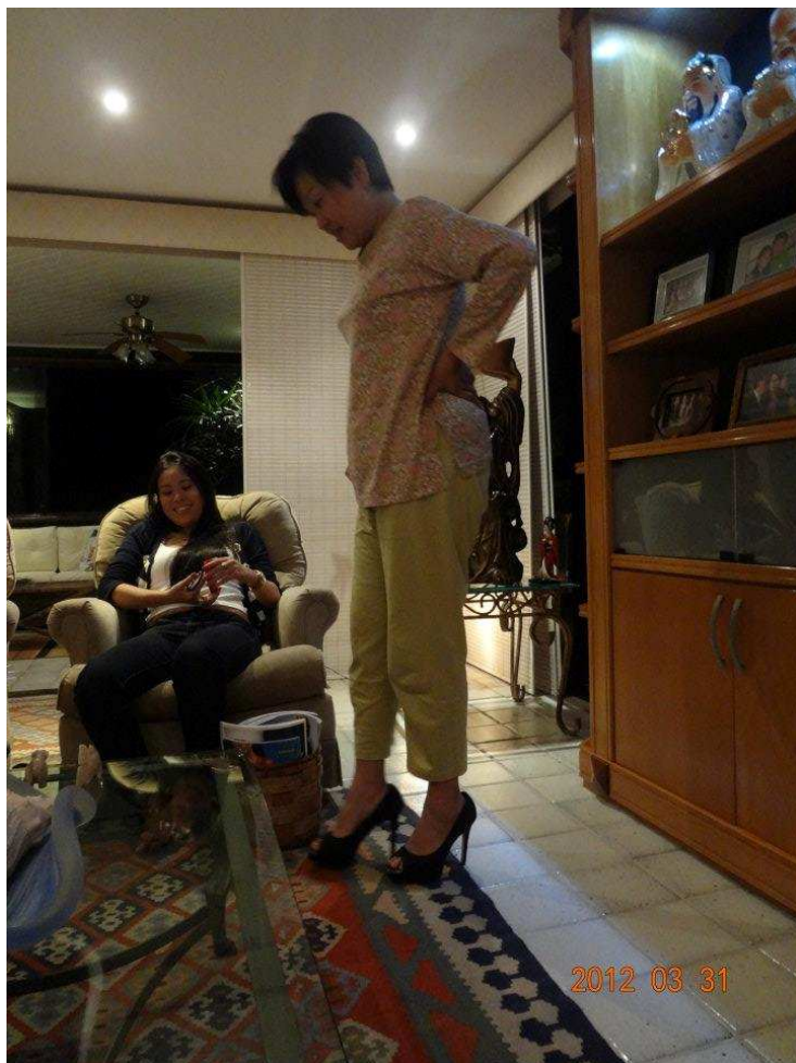
↑貴重！白井ママのハイヒールです！似合ってますよね？