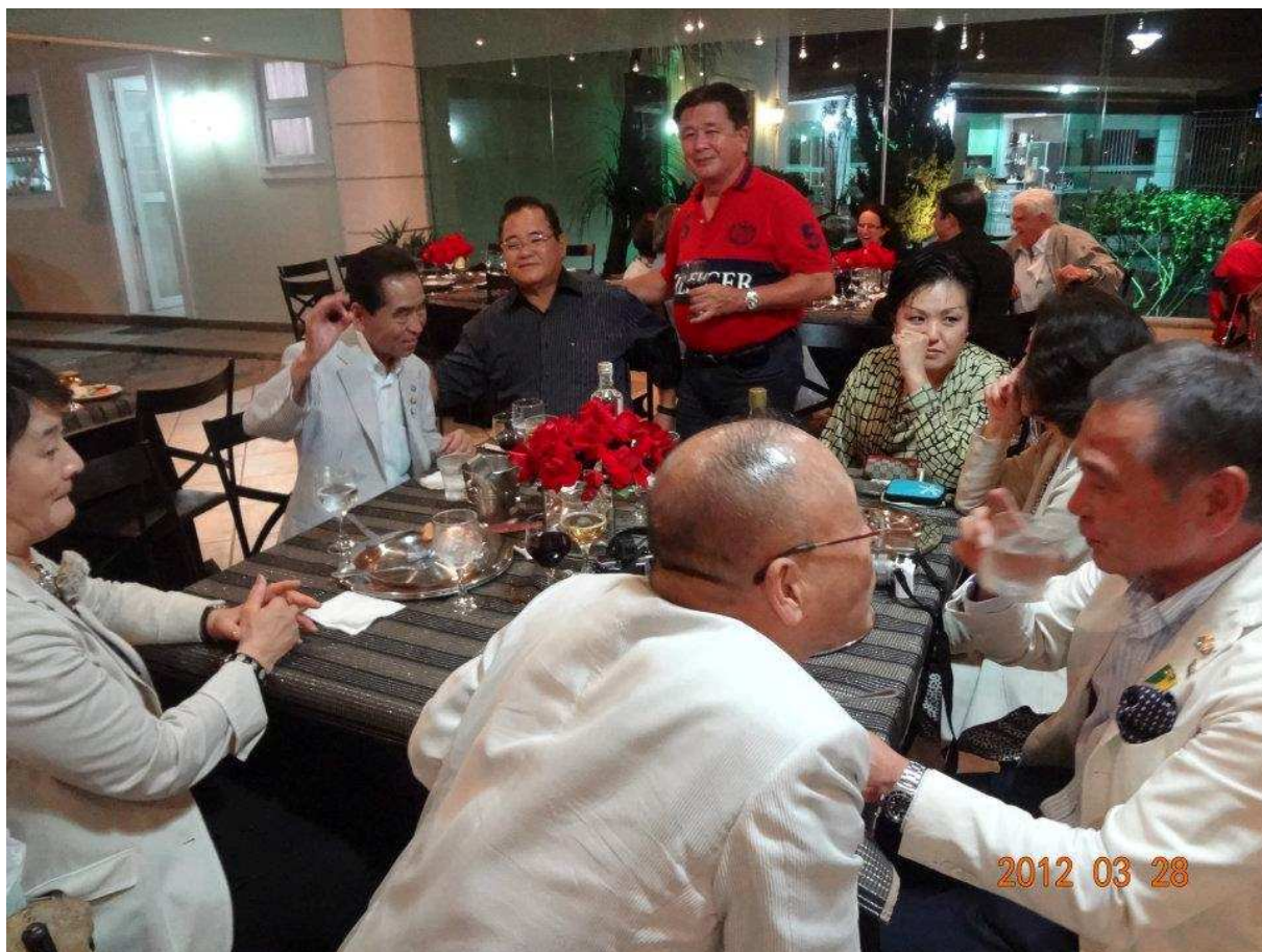
↑ みなさんわいわい^^