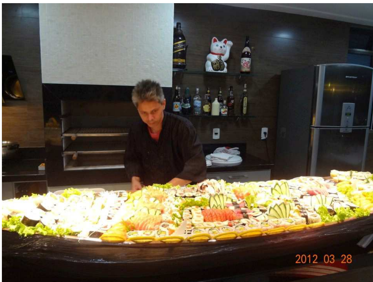
↑お寿司職人さんろお寿司の船盛です！