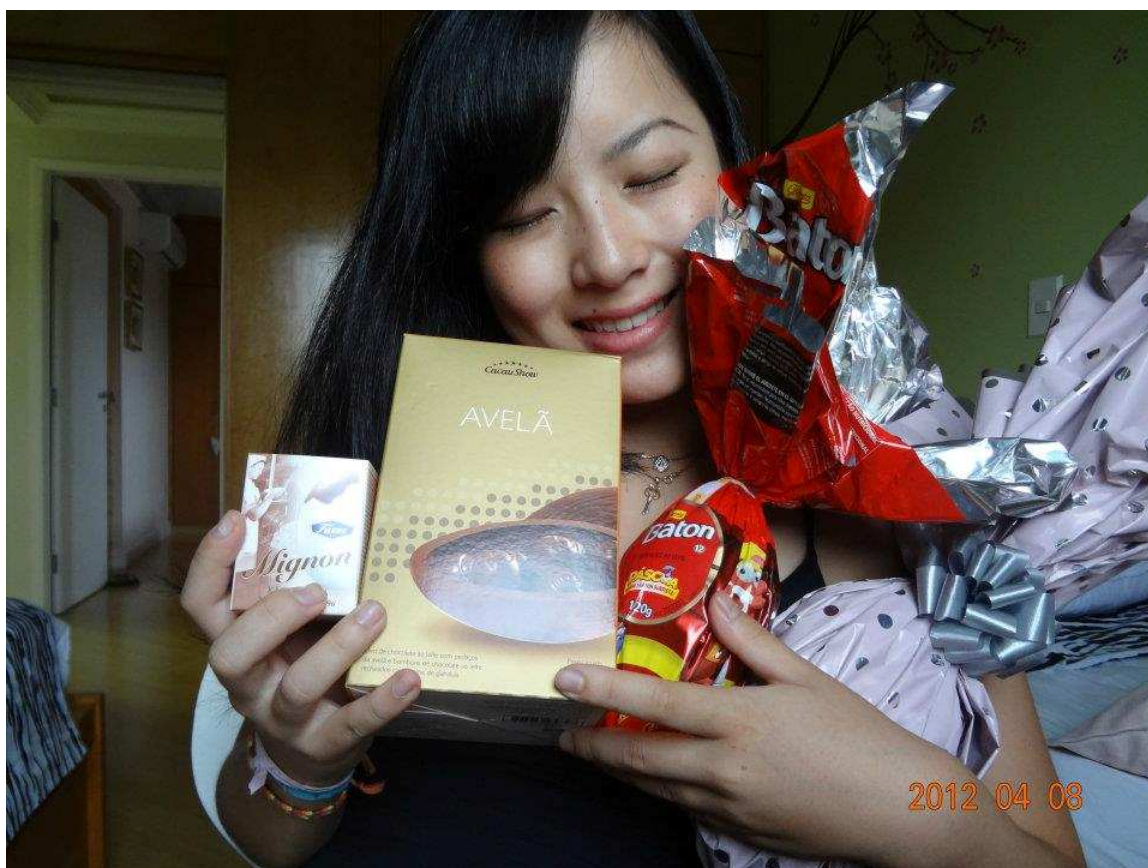
↑イースターではたくさんの卵の形をしたチョコをもらいました！幸せです^^