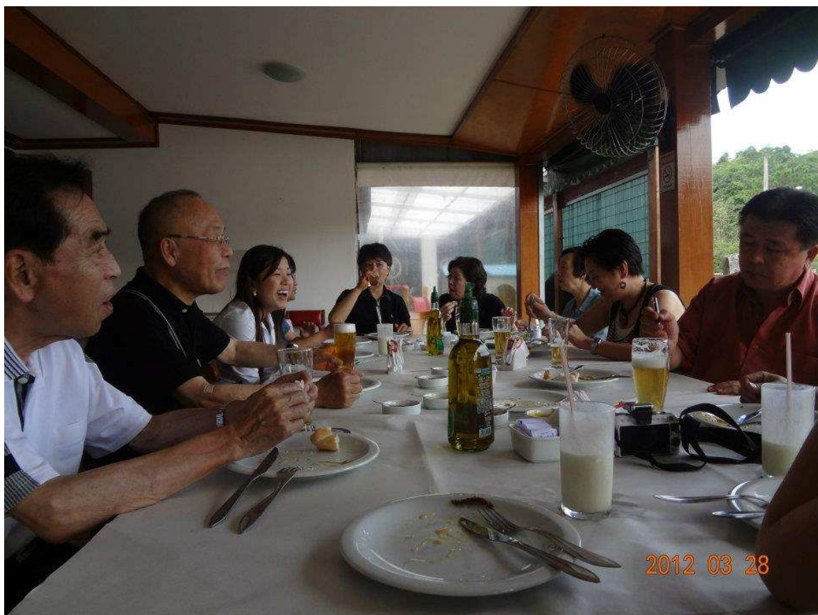
↑ みんなでドイツ料理屋さんでお昼ごはんです