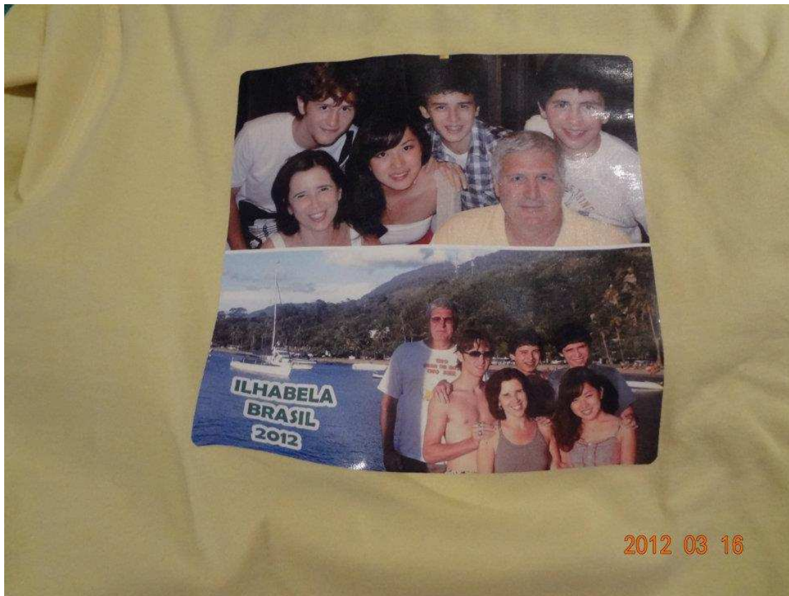
↑こんなに素敵な家族のTシャツを頂きました！毎晩これを抱いて泣いてました(；_；)