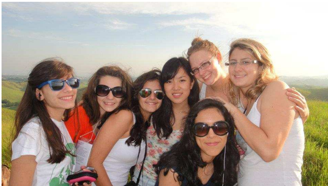
↑景色がとてもきれいでした^^