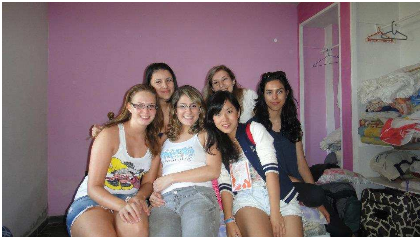
↑そして、私の家の宗教(プロテスタント?)のキャンプにも行ってきました