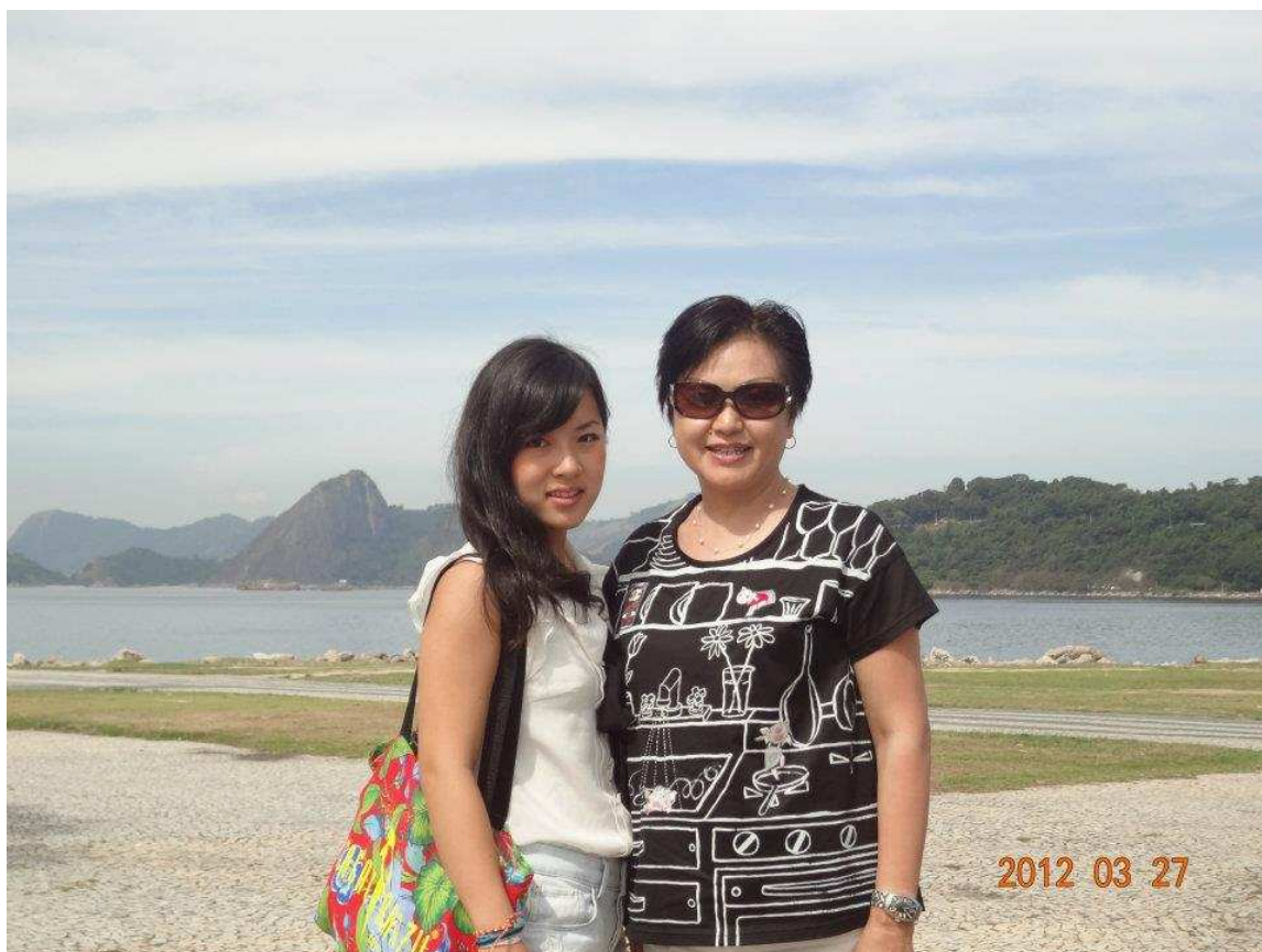
↑リオの海を背景に^^