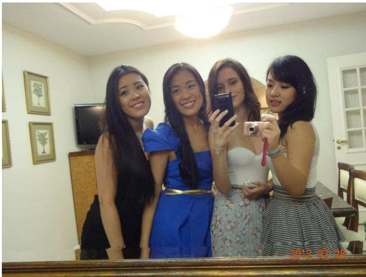
↑お寿司パーティでさえちゃん、れなちゃん、アリーニと。