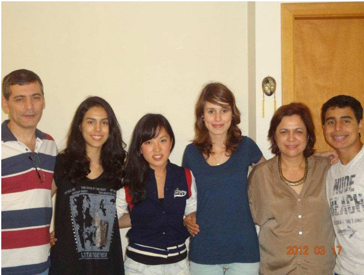
↑新しい私のホストです！