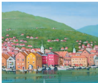
ベルゲン(ノルウェー) vol.10