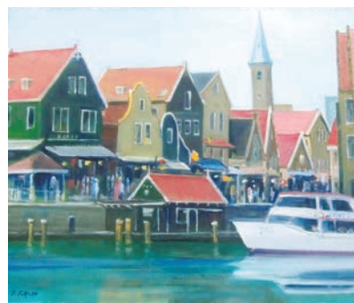
フーレンダム(オランダ) vol.6