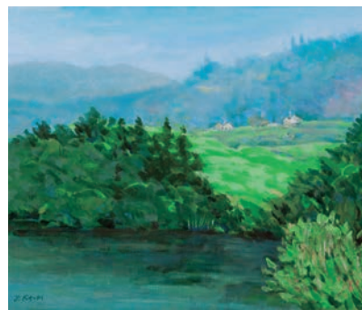
湖水地方(イギリス) vol.9