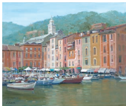
ポルトフィーノ(イタリア) vol.1