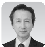
城 守 (姫路)