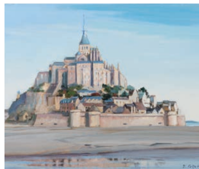
モン・サン・ミシェル(フランス) vol.3