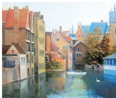
ブルージュ(ベルギー) vol.7