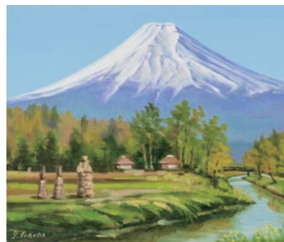
富士快晴(忍野八海) vol.12