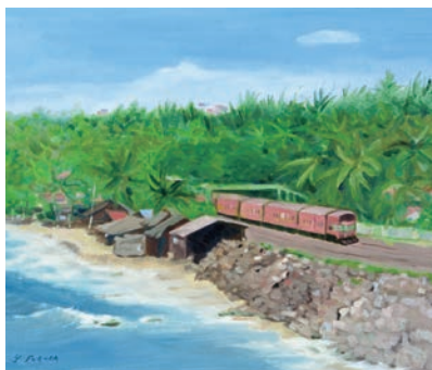
マウント・ラヴィニア海岸 (スリランカ) vol.8