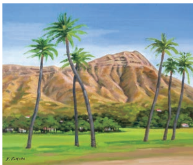
ダイヤモンドヘッド(ハワイ) vol.11