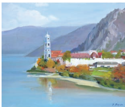
ヴァッハウ渓谷(オーストリア) vol.5