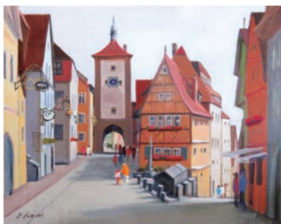
ローテンブルク(ドイツ) vol.2