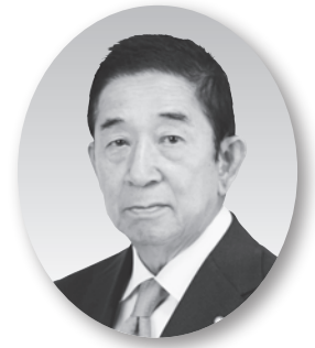
国際ロータリー第2680地区 ガバナー 矢坂 誠徳 (神戸西)