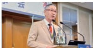
安行英文ガバナー