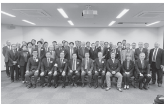
RLIパートII修了者及びRLI委員会 集合写真