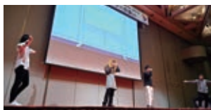
学友会ミュージカル