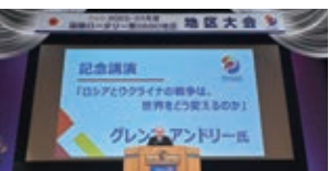
記念講演 グレンコ アンドリー氏