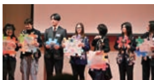
各学友会のパフォーマンス