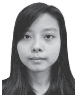
イン ジン ムエー (ミャンマー) 神戸YMCA学院専門学校 日本語 グルラジャーニー モハン (神戸南)