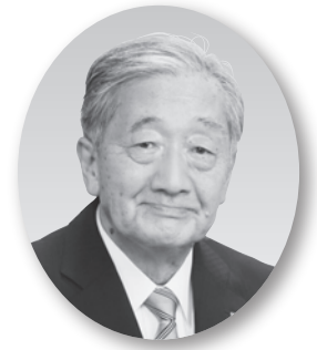
国際ロータリー第2680地区