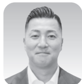
打保 陽 保税倉庫 8/18入会