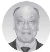
秋田 納 (川西猪名川)