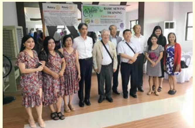
フィリピンマニラにて卒業式に参加