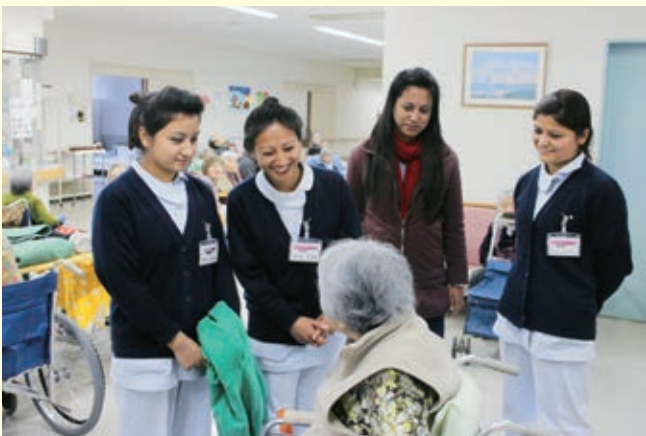
VTTネパールチームによる岡本病院での研修