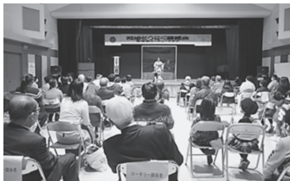
おもしろおかしな三味線芸に注目